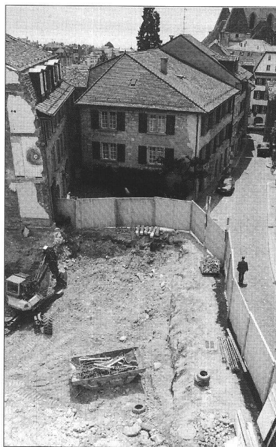
Vue des travaux de terrassement sur l'emplacement de la rue Cité-d'arrière N° 20. Ci-dessous, vue panoramique et «anticipative».

Malgré cette situation encore sombre, Philippe Diesbach estime que la