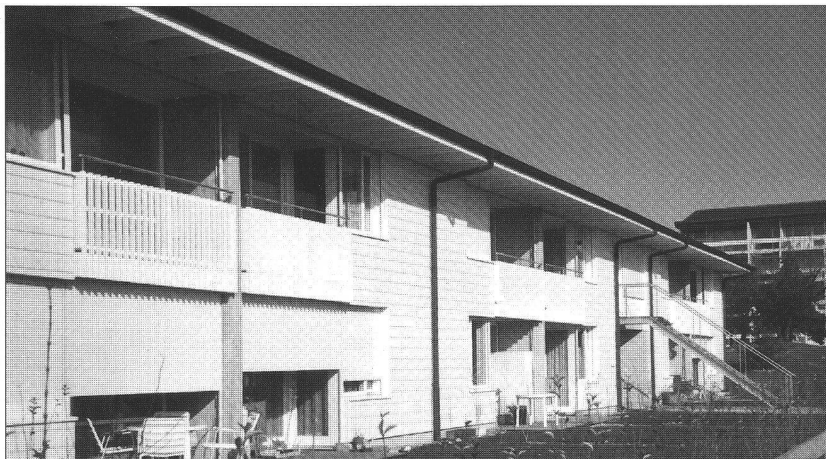
Vue prise, côté sud, des maisons avec jardin. En arrière-plan, l'escalier donne accès au studio de 40 m 2 . Répartis dans les autres pages, vues et plans de ce projet original.