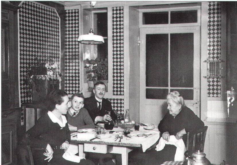
Un intérieur de classe moyenne dans les années vingt. Le fauteuil était un luxe et le salon une rareté. Depuis les mœurs ont changé. Les mœurs commerciales aussi...

soin de s'organiser mais le désordre de la distribution est devenu si violent, les pratiques agressives à ce point répétées qu'en très peu de temps une cinquantaine d'entreprises spécialisées dans la distribution de meubles, de la grande comme Pfister, à la moyenne unité ont décidé de rejoindre, en Suisse romande, les rangs de l'ARPA. L'une des premières tâches des professionnels organisés fut d'instituer une relation permanente avec la Fédération romande des consommatrices qui leur signale les cas où le rapport qualité-prix en matière de meubles a été foulé au pied. Par ce canal, arrivent chaque année plusieurs centaines de plaintes qui témoignent de pratiques déshonnêtes, évidemment négatives pour la corpo-