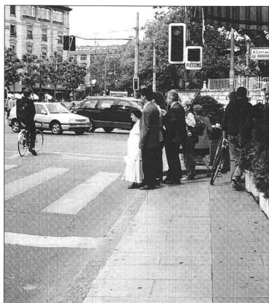
Espace d'attente trop restreint

apparence anodine, l'aménagement d'un passage piéton dépend d'une multitude de facteurs qui passent souvent inaperçus. Après avoir évoqué dans le dernier numéro l'histoire du passage piéton, attardons-nous aujourd'hui sur les multiples aspects techniques qui doivent être pris en compte pour réussir un bon aménagement répondant à des exigences multiples et élevées en matière de sécurité, de confort et pourquoi pas d'esthétique.