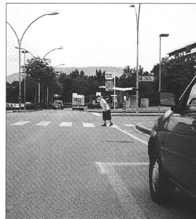
Voir pour être vu

Traverser une rue est pour beaucoup un acte banal. Les statistiques sur les accidents mettent en lumière de manière brutale que cet acte quotidien représente en fait un point noir en termes de sécurité. En effet, les 80 % des accidents impliquant des piétons le sont lors des traversées. Ces accidents représentent 10 % de l'ensemble des victimes de la circulation.