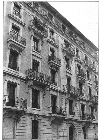
Plantamour, un succès mais...

Bâle-Ville est le canton en Suisse qui compte, relativement, le plus grand parc de logements coopératifs avec 10,33% du parc sous cette forme. Non seulement il s'agit là d'un canton entièrement urbanisé, mais en plus le gouvernement cantonal et Coop Bâle ont longtemps poursuivi une politique de promotion de coopératives d'habitation. La stratégie, typiquement bâloise, consistait à fonder une