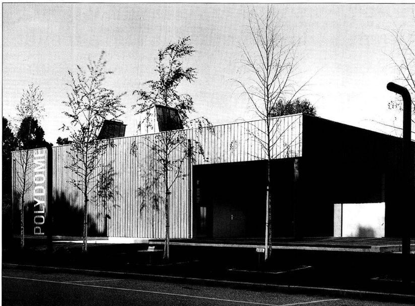
Annexe au Polydôme de l'EPFL, Ecublens 1997 - Maria Zurbuchen-Henz & Bernard Zurbuchen, architectes