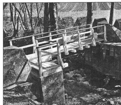
Passerelle du Moulin du Creux après transformation du barrage

Ces édifices ne sont par ailleurs rien d'autres que la plus récente phase de construction d'un processus de protection du territoire qui dure depuis plus de deux mille ans. On dispose aujourd'hui en Suisse d'innombrables publications sur les fortifications moyen-