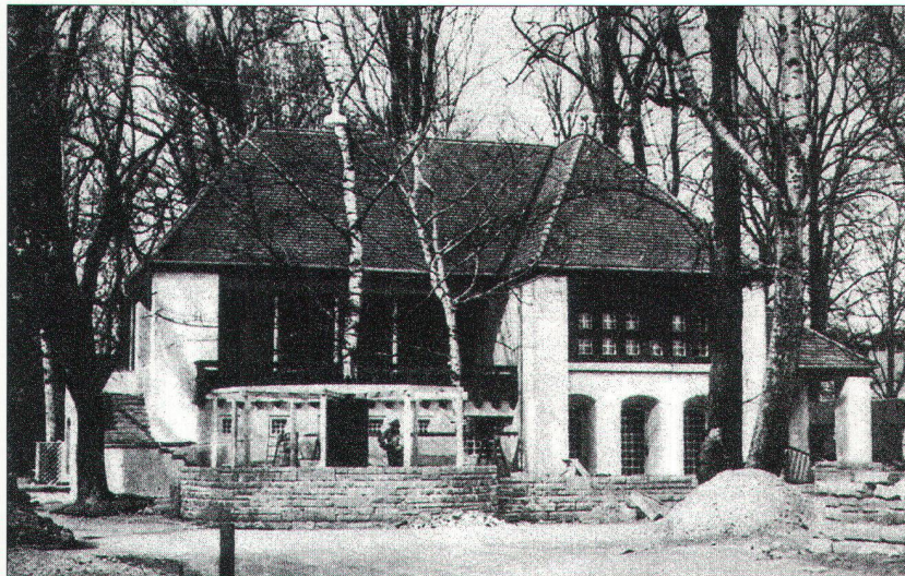
Cave vaudoise, Paul Lavenex, arch.