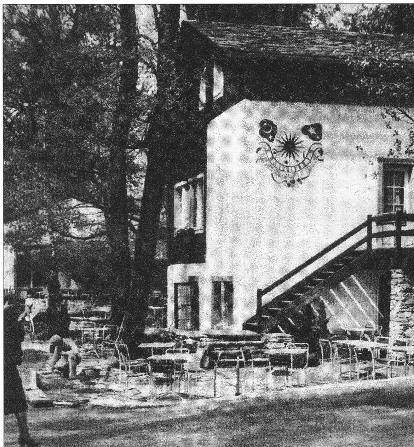
A l'Expo de Zurich de 1939

enève 1896, Berne 1914, Zurich 1939, Lausanne 1964... A moins d'une année de l'ouverture d'Expo 02, il vaut la peine de revenir sur les grandes expositions, ces "bateaux ivres des sociétés industrielles", comme les appelle l'historien Hans Ulrich Jost (1). A leurs débuts, ces expositions s'inscrivent dans la tradition des grandes foires du Moyen Age et sont essentiellement une occasion de vendre directement les produits de l'industrie, de cultiver le rapport au client. Très vite pourtant, elles se transforment en opérations de promotion de l'économie nationale, en "grand-messe du capitalisme industriel".