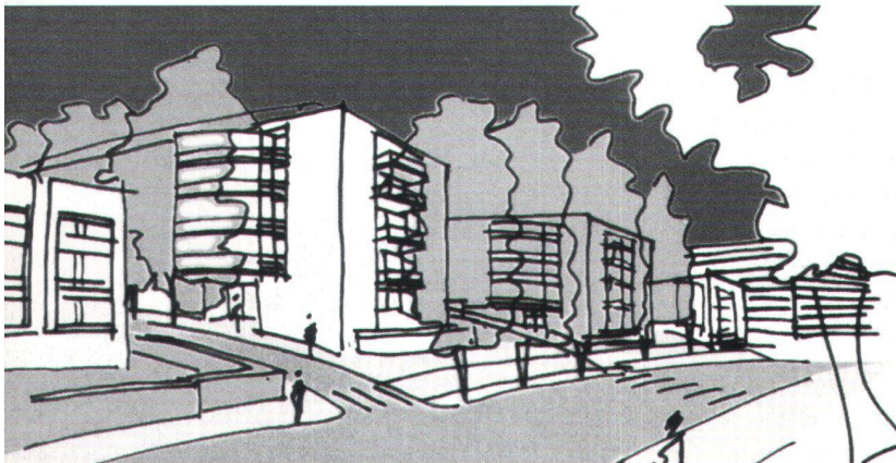
Projet SCHG/FLPAI. Vue de la rue des Franchises.

D'autre part, le secteur fait partie d'une zone de développement qui autorise une densité plus grande et, sur le plan économique, nous devons saisir les opportunités qui nous permettent mettre en valeur les terrains qui nous restent. D'autant plus que toutes les infrastructures nécessaires (écoles, bibliothèque, garderie, chaufferie centrale, transports publics, etc.) sont à disposition.