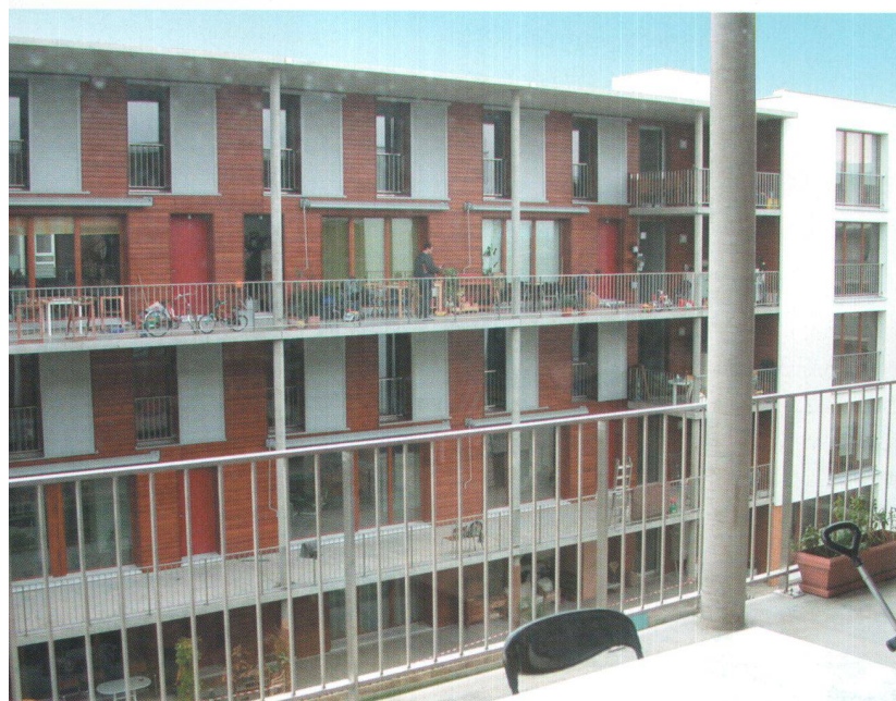
L'ambiance conviviale des immeubles 14-16

Notre principal objectif avait été en outre de créer de l'habitat mixte (HM), qui nous obligeait à avoir un minimum de 60% de logements subventionnés, le reste étant libre, au loyer correspondant à l'entier du coût de revient de l'appartement. La CODHA se bat depuis sa fondation pour le concept HM, l'idée étant que nous voulons de la mixité sociale au sein des immeubles, afin d'éviter de se retrouver avec une population stigmatisée par le type de subventionnement dont elle peut bénéficier.»