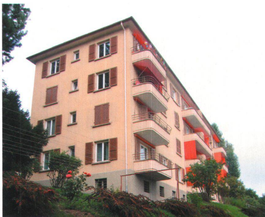
L'un des tout premiers immeubles construits par la coopérative à la rue des Valangines à Neuchâtel.