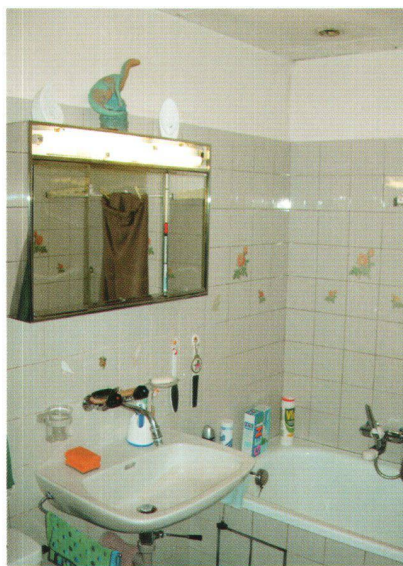
Salle de bains avant rénovation.