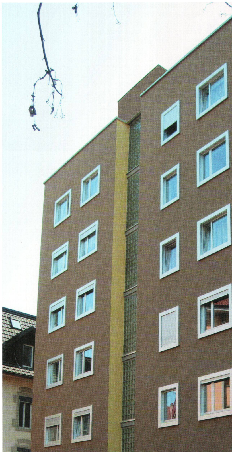
Vue générale de la nouvelle façade ouest.

Au-delà de la remise à neuf des locaux dits «humides», la mise en œuvre d'une ventilation contrôlée est un facteur d'amélioration du confort, ainsi qu'une source d'économies substantielle de consommation d'énergie. Les canaux verticaux originaux sont nettoyés. Il leur est associé une nouvelle distribution dans chaque pièce,