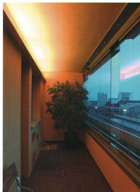
Balcon côté gare avant rénovation et nouvelle loggia vitrée côté gare.