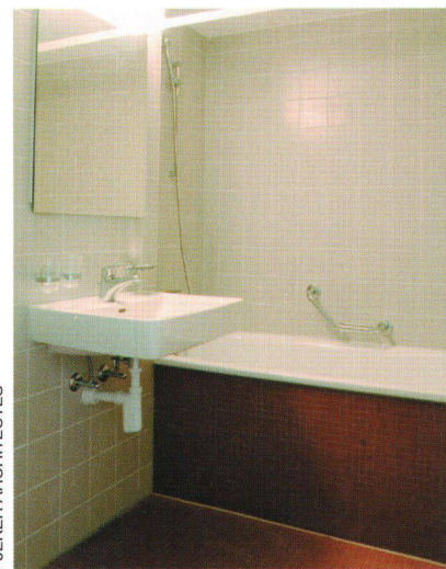
Nouvelle salle de bains, un châssis sanitaire préfabriqué intègre la technique et dissimule le meuble pharmacie.