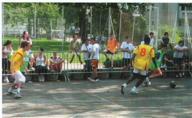
En plein match.