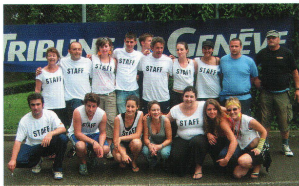
Les organisateurs du tournoi.