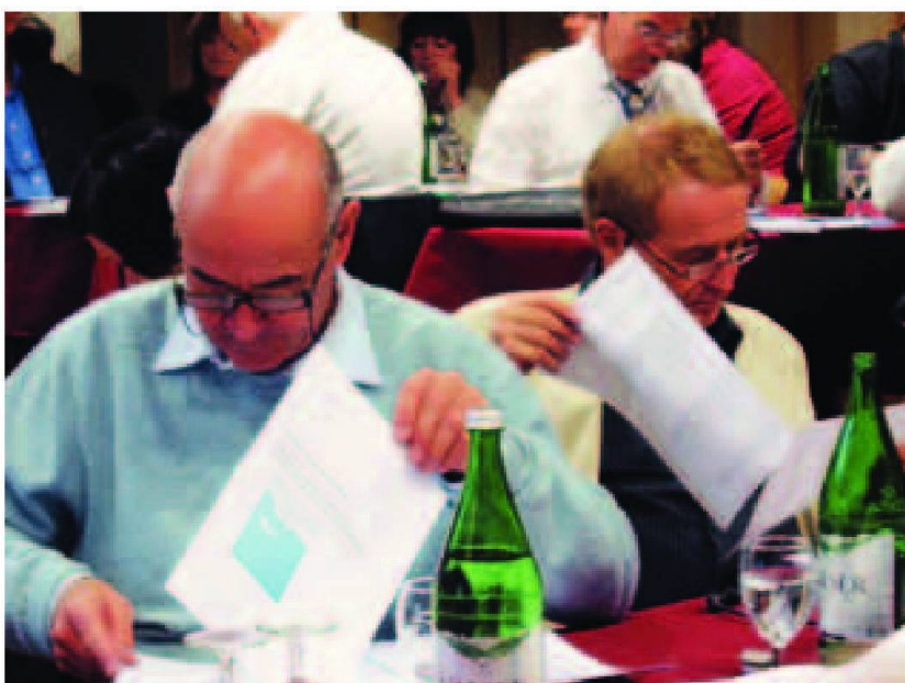
Entre paperasse et discours, il y avait du pain sur la planche...