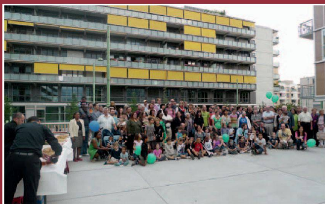
Une partie des nouveaux locataires pose pour la postérité.