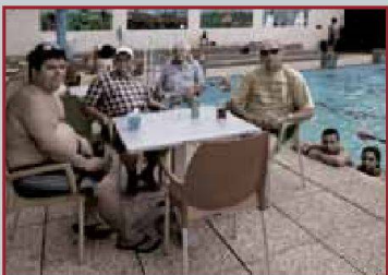
Piscine SCH Les Ailes, Genève-Cointrin.