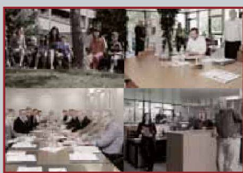
De gauche à droite: FLCL, Lausanne; Comité ASH romande, Lausanne; secréta- riat ASH romande, Lausanne; secrétariat SCHL, Lausanne.