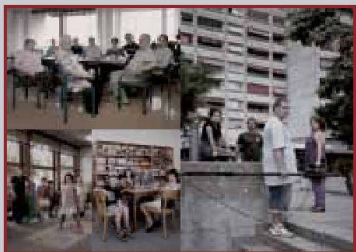
De gauche à droite: Tea time, FLPAl, Genève; Ludothèque La Marelle, Genève; staff de TV Bourdo-Net (www.tvbourdo.net), FLCL, Lausanne.