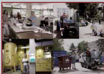
De gauche à droite: Buanderie et chaufferie, SCHG, Genève; SCH Les Ailes, Grand-Saconnex; place de jeux et déchetterie, FLCL, Lau- sanne.