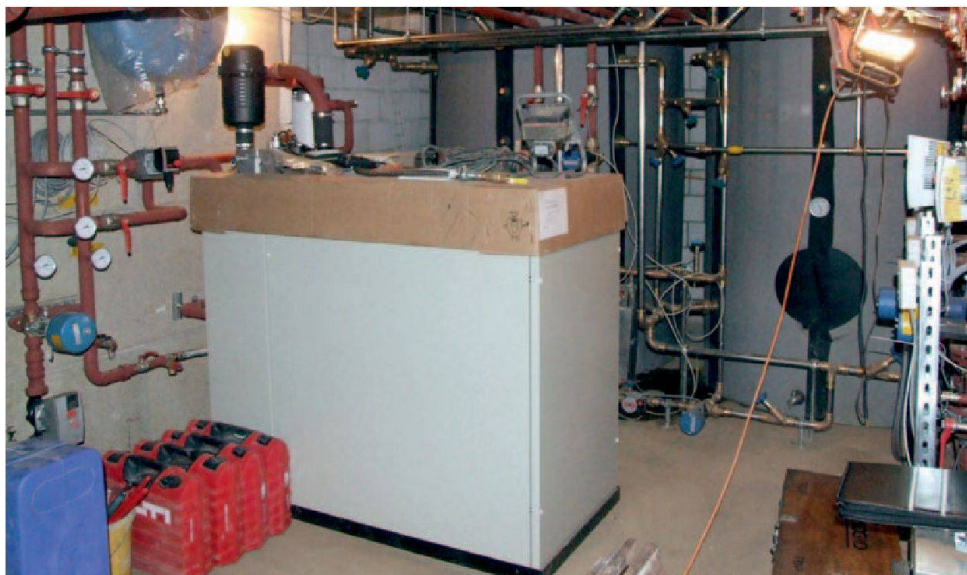
Vue de la salle technique avec au centre le bloc de cogénération.

Pour en apprendre davantage sur la domotique: www.domo-energie.com