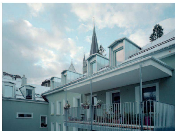
Vue de la cour intérieure commune de la rue Curtat 20 et 22, avant et après.

à conserver le charme et l'atmosphère de ce quartier de la Cité!) En plus, il fallait faire ces travaux de réfection dans un ordre logique afin d'éviter toute complication technique. Un planning précis et difficile fut donc élaboré.