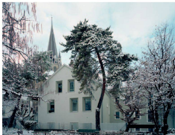
Les façades côté cour avant et après rénovation. © aas, © Silvio Do Nascimento