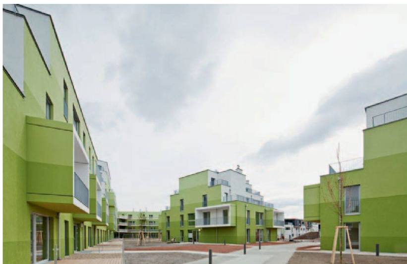
La cour fonctionne comme un véritable lieu de rencontre entre les habitants.

Le projet tient compte aussi bien de la famille classique que des familles recomposées. Comme il arrive souvent qu'il faille rapidement créer de la place pour des membres de famille supplémentaires, l'aménagement simple et rapide d'une chambre de plus contribue grandement à améliorer l'atmosphère de la vie commune. Et si un membre de la famille prend le large, on peut facilement réduire à nouveau le nombre de pièces par rapport à la surface habitable. La marge de flexibilité d'habitat est malheureusement souvent réduite dans les logements subventionnés. Pour le projet «ERZ», le bureau d'architectes AllesWirdGut (AWG) a tout simplement décidé de placer beaucoup de chambres sur le moins de surface possible. Les surfaces de liaison ont été réduites au maximum, les couloirs ont quasi complètement disparu, les séjours restent relativement petits, mais ces économies spatiales libèrent de la place pour créer des espaces séparés, temporairement ou durable-