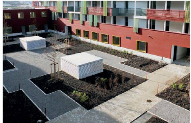
La cour intérieure, délimitée par les deux corps de bâtiments de la Giesserei.