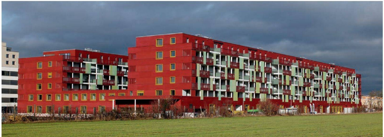
Les deux grands corps de bâtiments en bois de la Giesserei.

Ils n'étaient qu'une poignée au début de l'aventure; ils sont plus de trois cents à l'arrivée. Et ils ont construit la maison de leurs rêves, une énorme bâtisse en bois, où règne une grande mixité fonctionnelle, sociale et générationnelle. Standards écologiques dernier cri en sus.