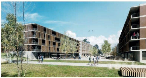
Les coopératives réaliseront une moitié des logements du grand projet des Vergers, à Meyrin.