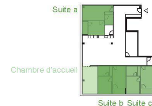
1 er étage