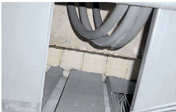
Interdit depuis 1990, l'amiante se trouve encore dans des immeubles construits avant 1990: ici, pour isoler la tuyauterie.