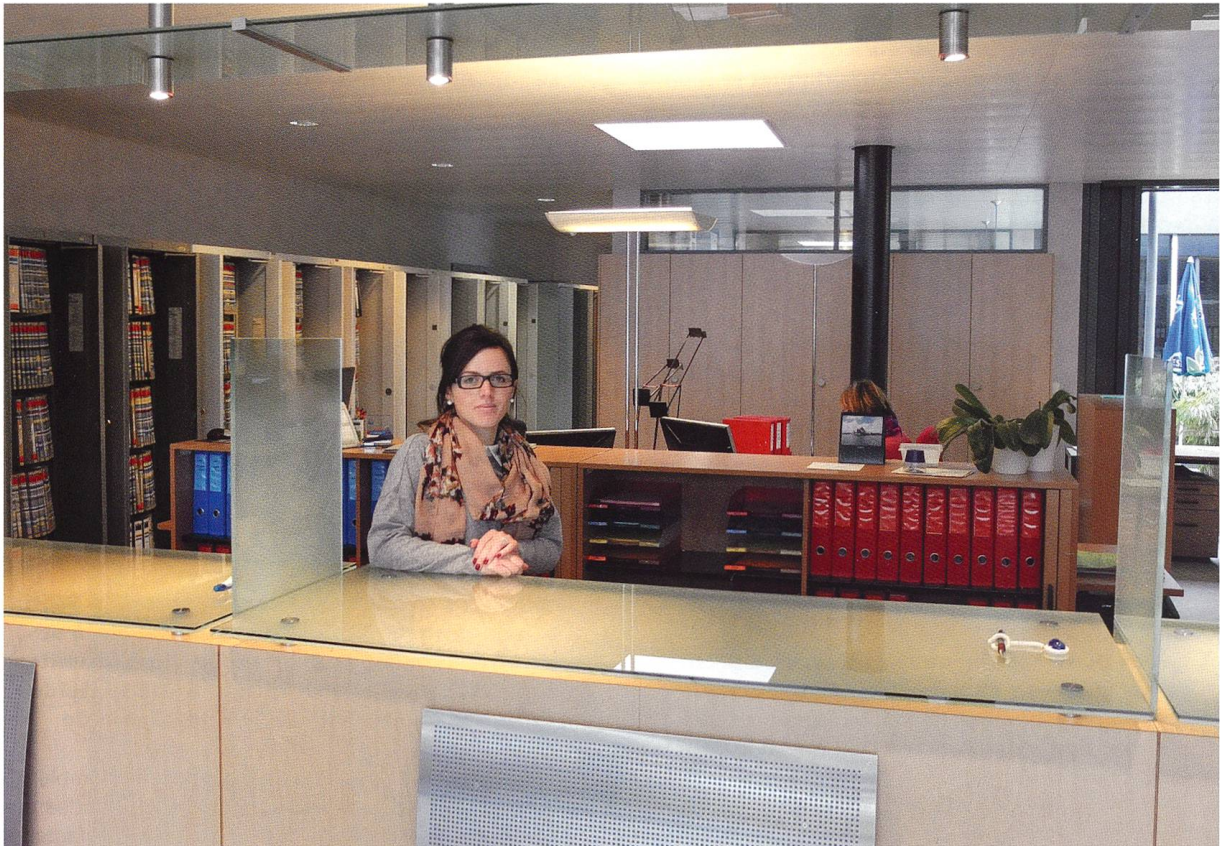
Le guichet d'accueil de la SCHL à Lausanne

de logement à loyer abordable, soit à prix coûtant, est capitale: nous ne sommes pas des promoteurs immobiliers qui construisons au meilleur rendement possible pour une poignée d'actionnaires; nous construisons pour répondre à une demande réelle de logements d'une bonne partie de la population et pas pour placer de l'argent. Nous ne sommes pas des promoteurs, nous sommes des constructeurs! Et si une commune souhaite développer tout un quartier, nous pourrions tout à fait entrer en matière, notamment au vu de notre expérience positive avec la construction de l'écoquartier de Maillefer.