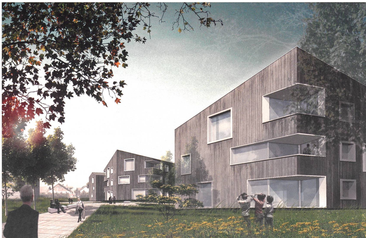
Image de synthèse des immeubles SCHL à Cheseaux

Bon nombre de nos immeubles disposent d'aménagements extérieurs tout à fait standard, genre gazon et arbustes; mais la tendance aujourd'hui, c'est des aménagements extérieurs favorisant la biodiversité, histoire de diversifier de nouveau la faune et la flore indigènes en milieu urbain, tout en limitant la charge d'entretien 4 . On passe du gazon tondu à ras qu'il faut tondre chaque semaine, à la prairie fleurie, que l'on fauche deux ou trois fois par saison. La commune de Lausanne a lancé un programme allant dans ce sens et cherchait une société qui puisse jouer le jeu et donner l'exemple. Nous avons tout de suite été partant, d'autant plus qu'un des membres de notre comité de gestion est précisément le chef jardinier de la Ville de Lausanne. Nous menons donc actuellement un projet d'étude autant pilote que participatif avec nos locataires de Boisy, en plein centre-ville, pour déterminer comment nous pourrions transformer leurs aménagements extérieurs pour répondre à la fois aux désirs de nos locataires et aux objectifs de la Ville de Lausanne... et donner envie à d'autres propriétaires de jouer le jeu.