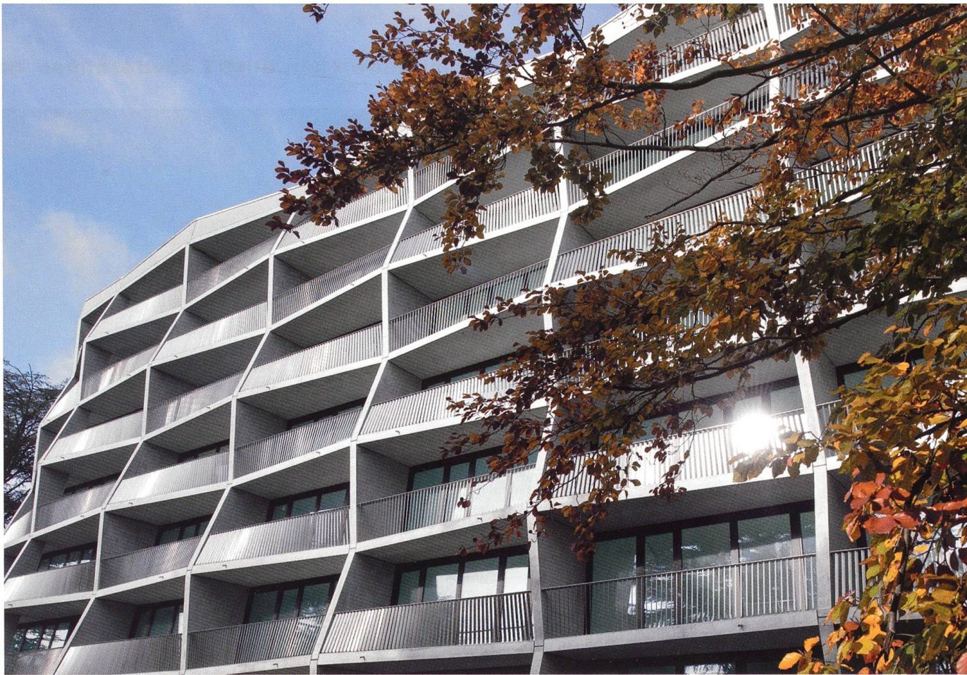
Dans des zones de développement, les villas commencent à céder la place aux immeubles sur des terrains rachetés par des promoteurs ou par l'Etat. La SCHG a achevé cette année un premier bâtiment, avenue de Joli-Mont.

qui n'en était pas à sa première expérience, et Equilibre, qui n'en avait pas encore, mais a fait preuve de beaucoup d'imagination. Aujourd'hui, dans un autre exemple du même type, un terrain au Grand-Lancy a été attribué à la SCHS et l'Habrik, qui entendent favoriser notamment le regroupement de l'habitat et de l'activité économique. Dans le cadre d'une situation aussi particulière, nous avons collaboré, dans le quartier du Pommier au Grand-Saconnex, avec la Codha et Rhône-Arve, avec qui nous partageons même un immeuble. Initialement, le PLQ prévoyait de petits immeubles séparés. Les circonstances nous ont amené à collaborer plus étroitement, et à réaliser in fine les deux premiers bâtiments Minergie Plus du Canton de Genève!