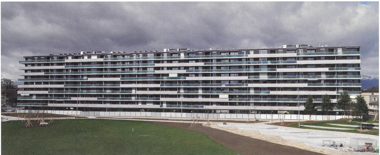
Dans des zones sur le site de l'ancien stade des Charmilles, la SCHG a construit 96 logements. Fruit d'une collaboration avec un promoteur, le bâtiment comprend également des appartements en PPE.

Il y a différents cas. Typiquement, à Cressy, le Groupement avait attribué à trois coopératives les trois objets à construire sur une seule parcelle. Les échanges et contributions ont été fructueux, notamment pour deux d'entre elles, la Société coopérative pour l'habitat social (SCHS)