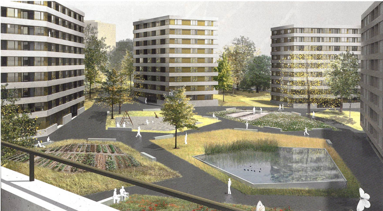
Démarrage en mai-juin d'une réalisation de 63 logements, préambule à la réalisation du projet Papillon (550 logements) sur le site emblématique de la SCHG, près de la Servette. ©Timothée Giorgis Architectes

tiennent à la SCHG et à son partenaire, la Fondation des logements pour personnes âgées ou isolées à Genève (FPLAI). Du côté de la route des Franchises, le projet fait face à un parc colonisé par les écureuils, du côté de la route de Meyrin, à des villas situées sur des terrains en zone de développement, en pleine dynamique de construction-reconstruction. Selon le planning défini par les autorités, l'enquête publique du PLQ devait être lancée en juillet 2014, elle ne l'a été qu'en février 2015. C'est d'autant plus regrettable que l'Etat et la Ville sont les premiers à ne pas respecter les délais légaux qu'ils s'imposent.