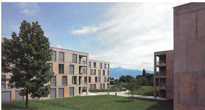
Un site avec vue sur le Léman.