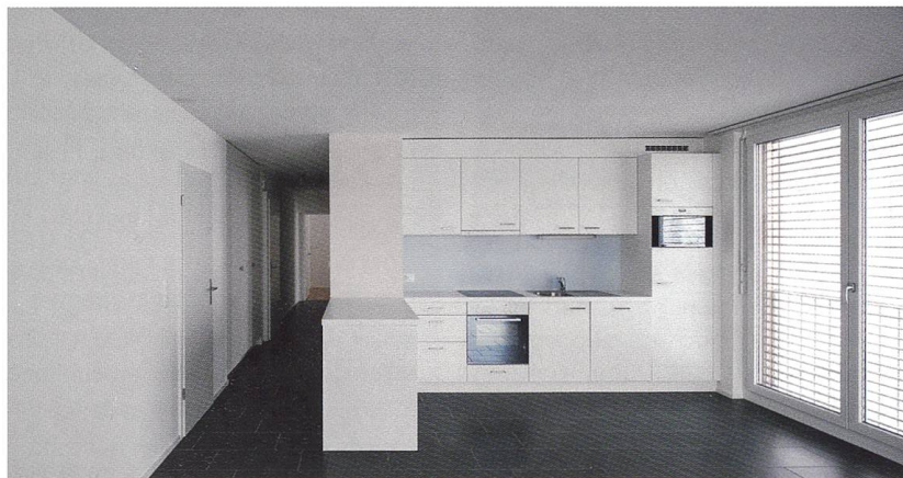
Coin cuisine dans les appartements de plusieurs pièces IDR