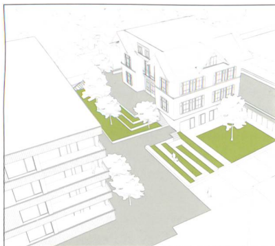
Les aménagements extérieurs jouent avec les différences de niveaux.