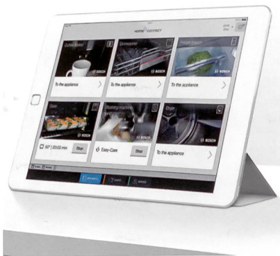
Le selfie de votre frigo.

informé quand vous devrez intervenir vous-même durant la cuisson. Avec, à la clé, un rôti digitalisé vraiment plus tendre et gouteux?