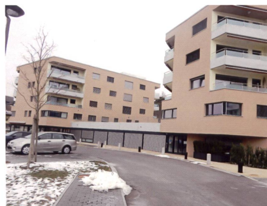
Les deux bâtiments de mixAGE sont situés à la rue de la Vernie à Crissier.

L'isolement social étant un facteur prépondérant de fragilisation, le projet mixAGE a réalisé un ensemble de logements sécurisés et adaptés, des