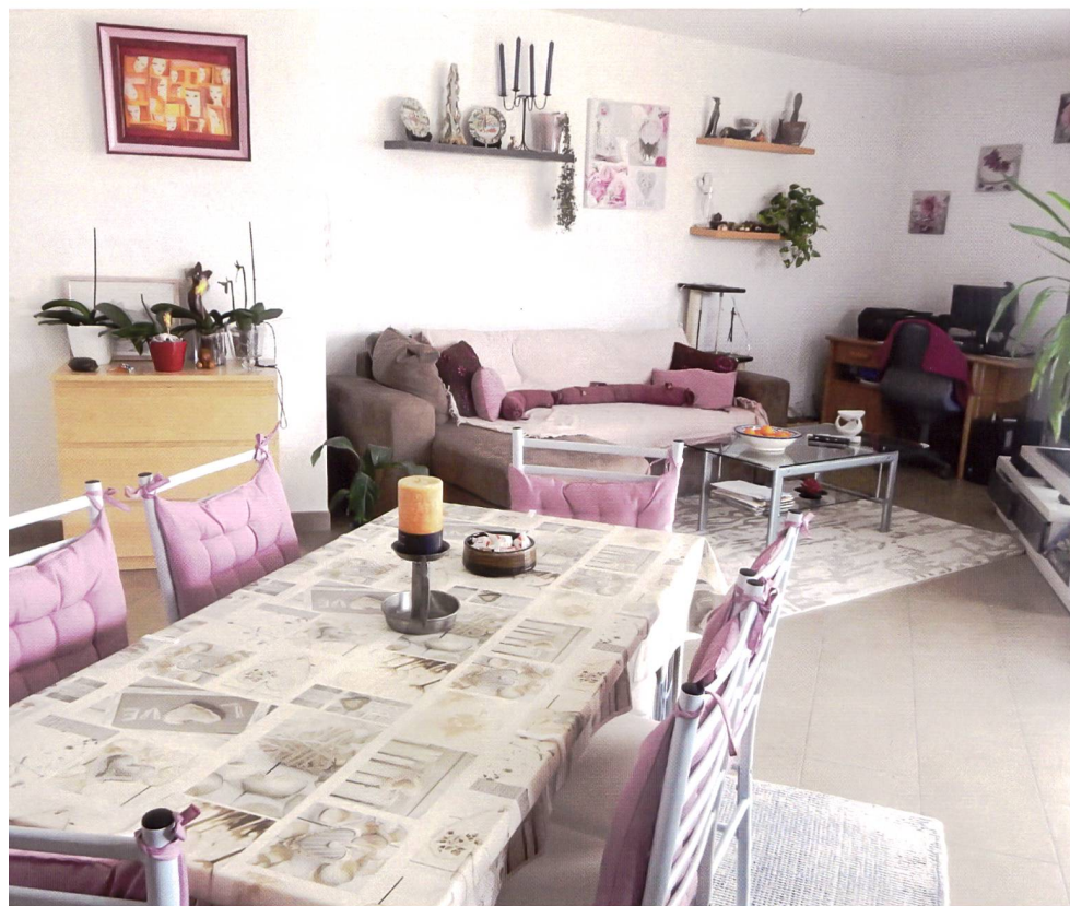
Les chambres des résidents sont à la fois spacieuses et claires.