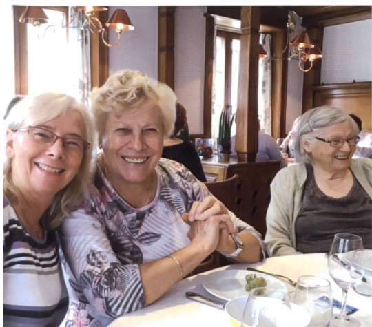
Les activités organisées pour les résidentes de mixAGE sont nombreuses. Lors de la brisolee de l'automne passé, le bonheur était au rendez-vous!

senior peut aussi s'adresser à l'étudiant de son étage pour rédiger et taper une lettre. Enfin, mentionnons que quelques logements de 2½ et 3½ pièces sont loués à des familles et que le bâtiment bénéficie de prêts hypothécaires à taux réduit de l'Etat de Vaud et de fonds issus de la LOG (fonds de roulement et CCL).