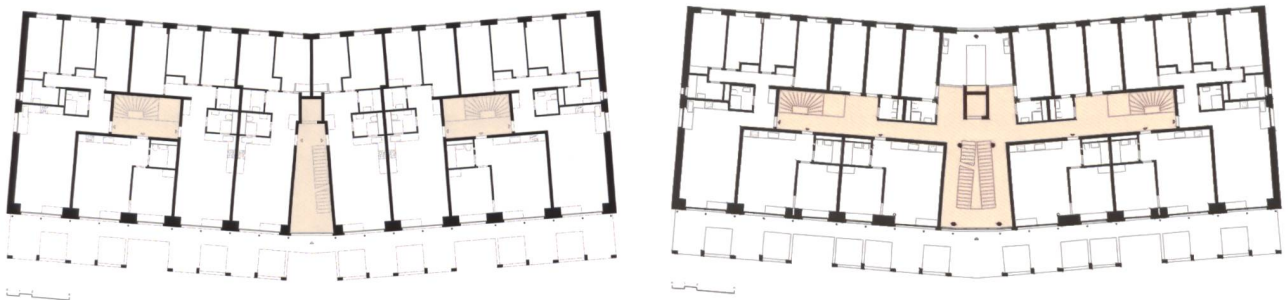
Plan du 1 er étage (g) L'ascenseur ne dessert que les appartements du milieu. L'accès aux autres appartements est possible par les passerelles. Au 3 e étage (d), la «rue intérieure» met en relation l'ascenseur et les cages d'escaliers situées à l'Est et à l'Ouest.