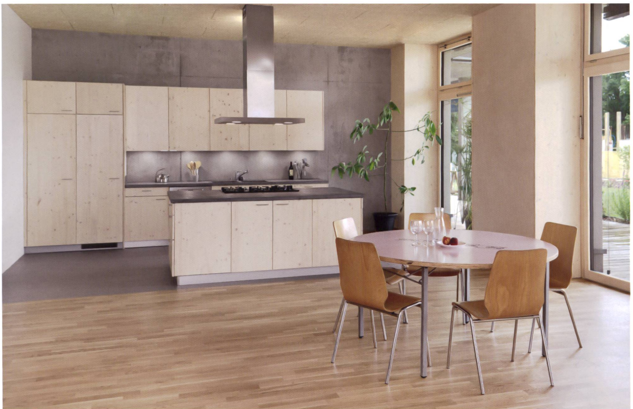
La grande salle commune.