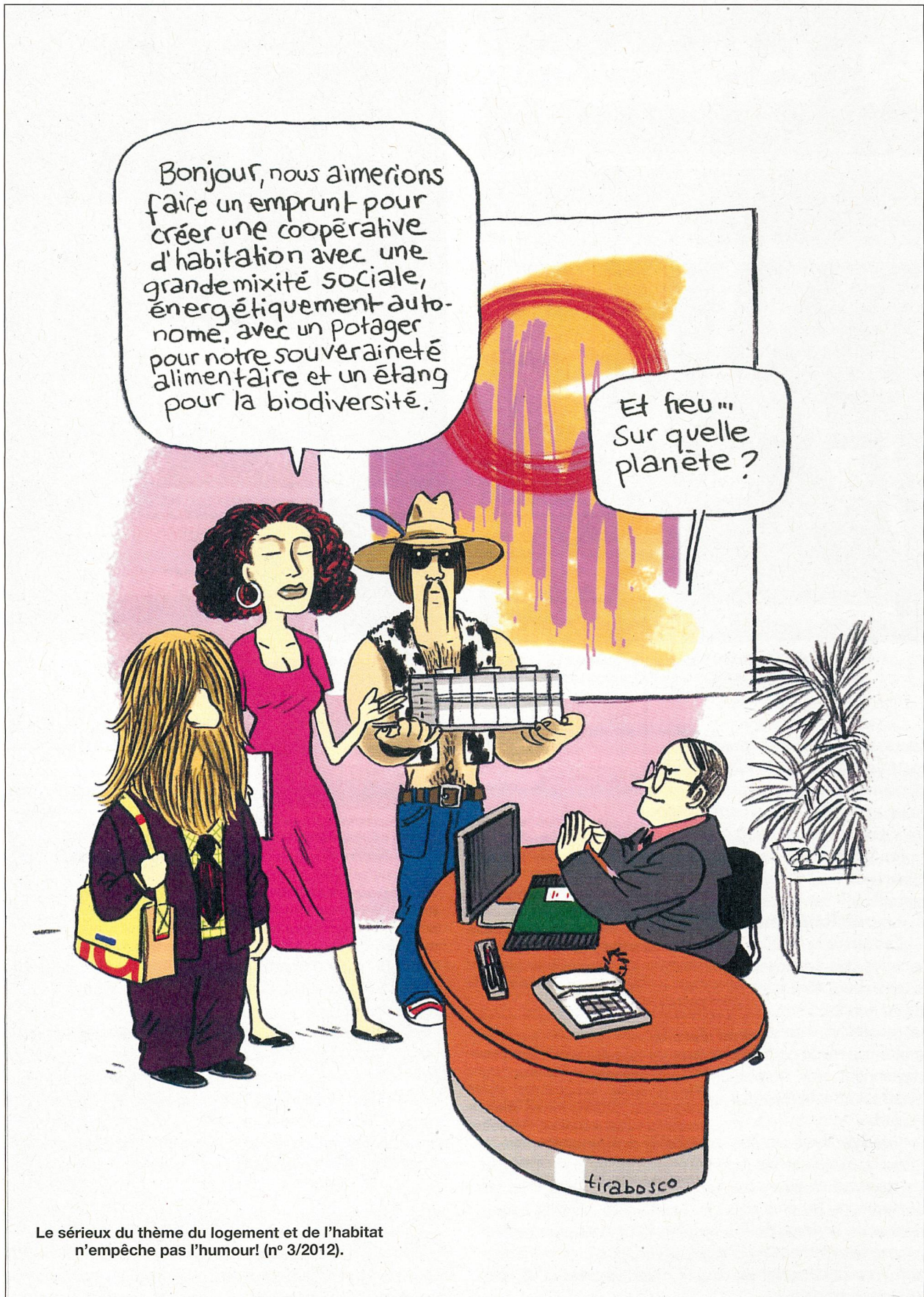
Le sérieux du thème du logement et de l'habitat n'empêche pas l'humour! (n° 3/2012).