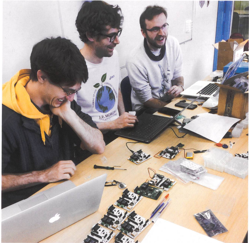
Le groupe des initiateurs du projet Comobilis.org en plein travail!

En Romandie, cinq immeubles existent sans ou avec très peu de voitures: situés dans les quartiers de Cressy, Soubeyran et Vergers, à Genève, ils ont été inaugurés en 2011, 2017 et 2018, et disposent de quelques places de parc pour l'autopartage. Vous avez dit «autopartage»? Tout a commencé dès les premières discussions entre les futurs coopérateurs-locataires de la coopérative Equilibre pour définir le premier projet immobilier à Cressy. La plupart d'entre eux n'avaient pas de voiture privée et ceux qui en avaient une étaient prêts à s'en séparer. Il a donc été décidé que les contrats de bail de la coopérative Equilibre incluraient une clause de renonciation à la voiture privée. Avec l'attribution de l'appartement, les coopérateurs s'engagent à abandonner leur voiture privée. Mais que faire pour tout de même disposer d'une voiture en cas de besoin (pour se rendre dans un endroit difficile d'accès en transports publics, ou pour un week-end ou une semaine de vacances avec les enfants)? Une idée a alors germé: pourquoi la coopérative ne dispose-