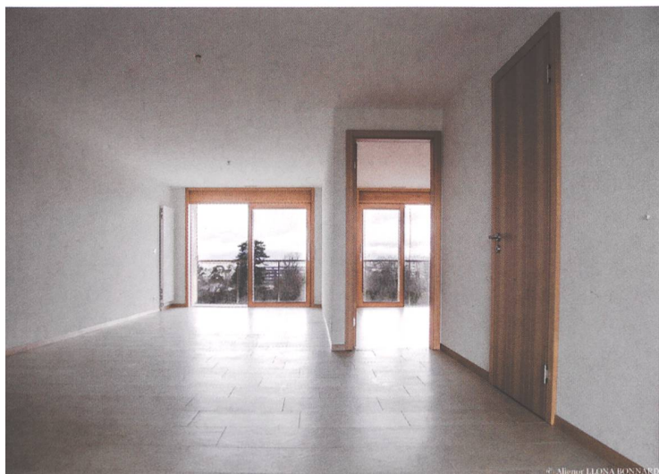
Les typologies privilégient les 2, 3 et 4 pièce.