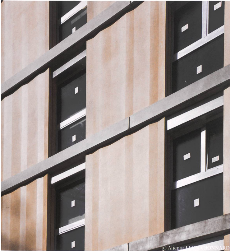
Des cannelures enrichissent le profil des façades et déterminent des variations de lumière.

semble, il n'y a pas de plus grands appartements», poursuit notre interlocuteur. Une particularité qui donne une idée assez claire des typologies les plus recherchées dans le chef-lieu vaudois. A la SCILMO, les prix s'échelonnent entre Fr. 946.– pour un deux pièces (49 m 2 ) et Fr. 1756.– pour un logement de quatre pièces (96 m 2 ), plus charges, mais avant abaissement de 24% pour les appartements subventionnés du bâtiment C.