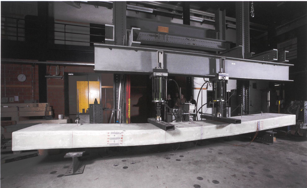
Le CCLAB de l'EPFL est équipé de machines pour effectuer des tests de résistance de barres en matériaux composites.

Comparés à l'acier, les matériaux composites sont beaucoup plus légers, ils ont une meilleure durabilité (s'ils sont correctement appliqués) et ils sont beaucoup plus isolants (à base de fibre de verre). Concernant la résistance au feu, ils doivent aussi être protégés, comme l'acier. Dans certains cas, l'utilisation de matériaux composites peut donc être très intéressante.