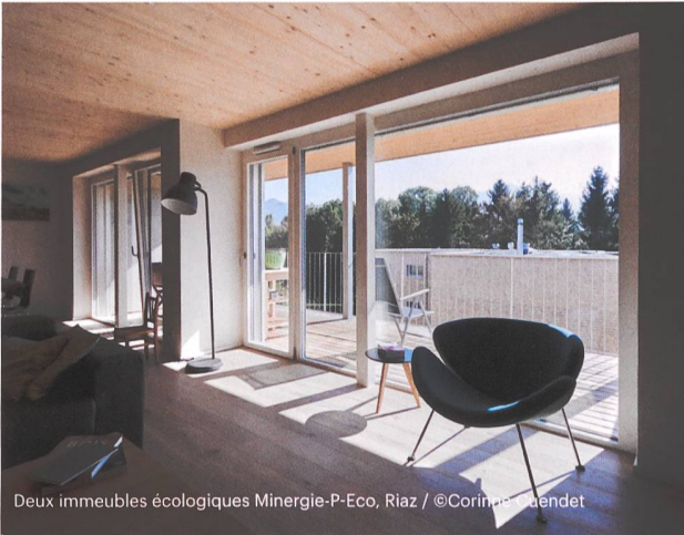
Deux immeubles écologiques Minergie-P-Eco, Riaz