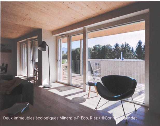
Deux immeubles écologiques Minergie-P-Eco, Riaz