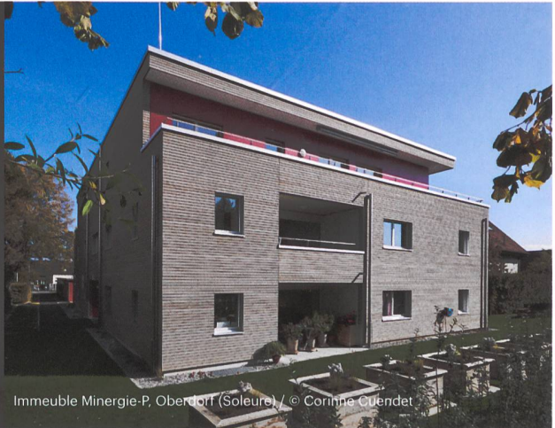
Immeuble Minergie-P, Oberdorf (Soleure)