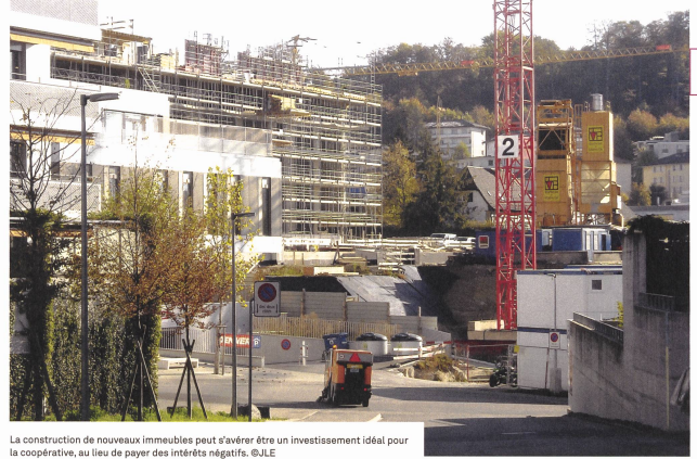
La construction de nouveaux immeubles peut s'avérer être un investissement idéal pour la coopérative, au lieu de payer des intérêts négatifs.

En principe, les coopératives sont également concernées par ces intérêts négatifs, mais ont-elles des possibilités d'éviter de les payer? Nous les avons explorées en demandant leur avis à deux présidents de coopératives d'habitation romandes: