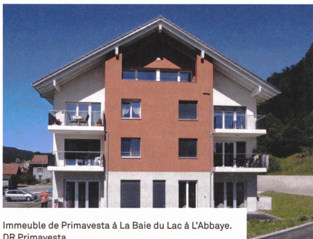
Immeuble de Primavesta à La Baie du Lac à L'Abbaye.

> Plus d'infos, argumentaire et Factsheet: http://www.egw-ccl.ch/fr/credit-cadre-2021/ .