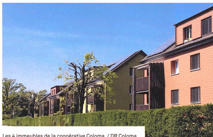
Les 4 immeubles de la coopérative Coloma.

Si Primavesta est une coopérative de taille moyenne, la coopérative Coloma à Marin-Epagnier est de taille beaucoup plus modeste. En avril 2020, elle a été en mesure de refinancer 1 million de francs de la série CCL N° 24 au moyen d'argent frais tiré du dernier emprunt – pour une durée de 20 ans. Une conversion refinancée par la CCL dans les règles de l'art à environ 40% de l'hypothèque arrivant à échéance. Grâce à cette aide, la coopérative a pu ensuite obtenir un crédit résiduel auprès de la Banque cantonale. La coopérative Coloma participe en outre à deux autres emprunts CCL.