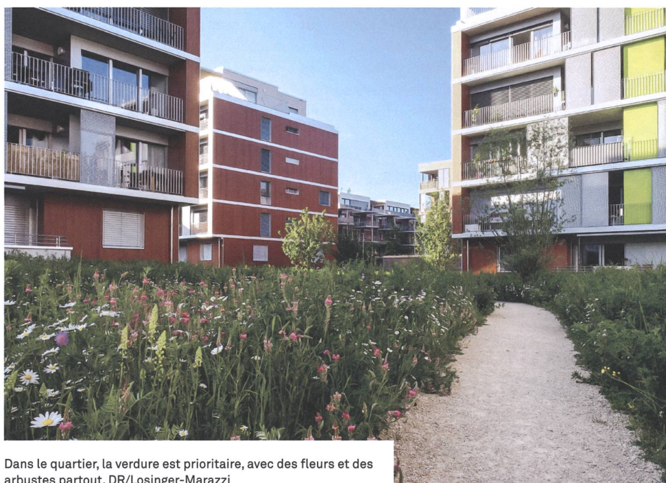
Dans le quartier, la verdure est prioritaire, avec des fleurs et des arbustes partout.

Depuis une année, l'association de quartier AQEnøtt est en stand-by, après des