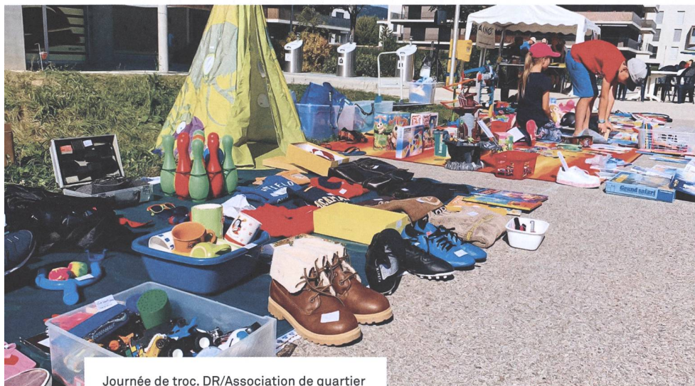
Journée de troc.