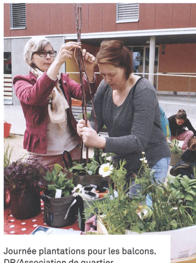
Journée plantations pour les balcons.