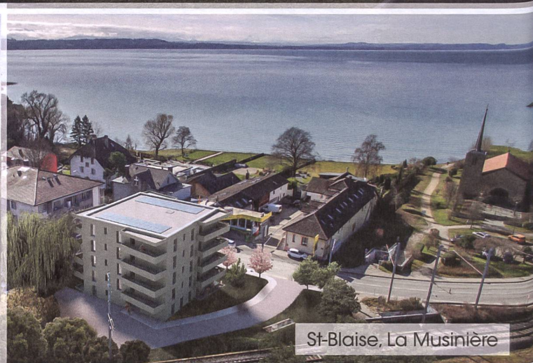
St-Blaise, La Musinière