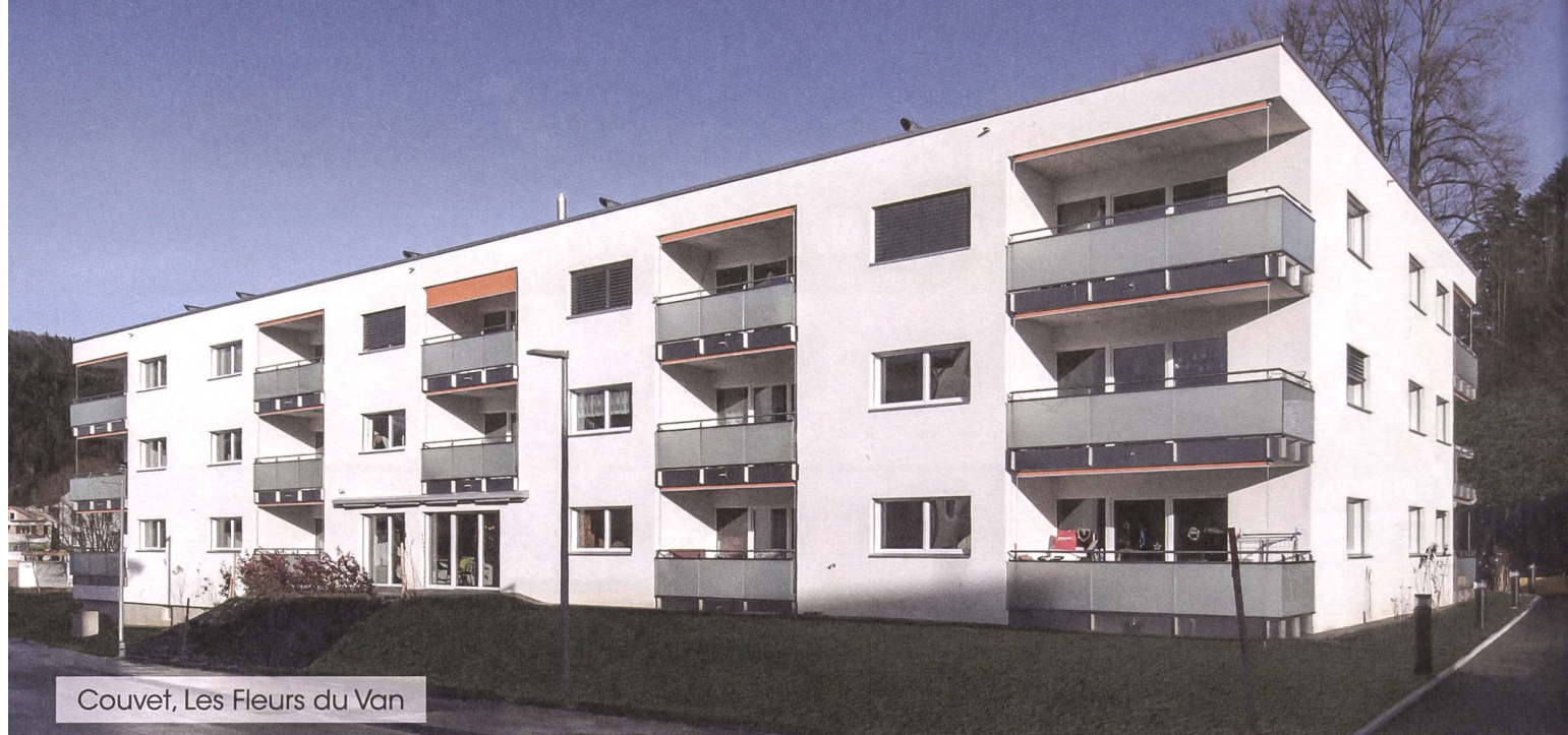
Couvet, Les Fleurs du Van