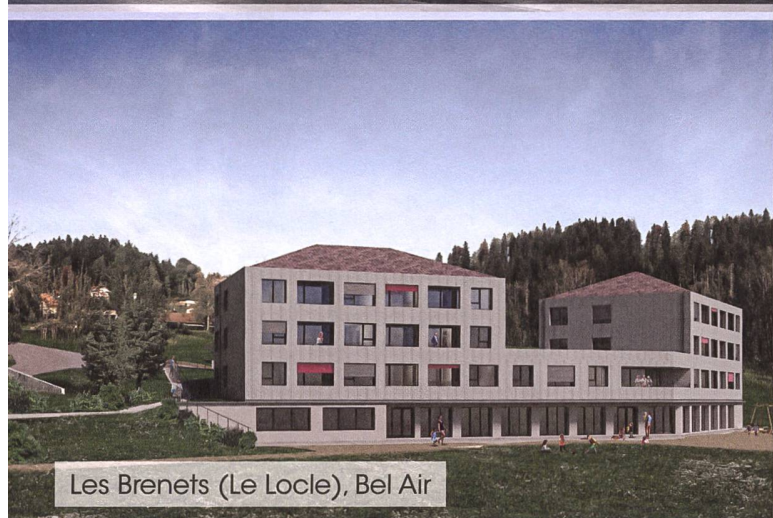
Les Brenets (Le Locle), Bel Air