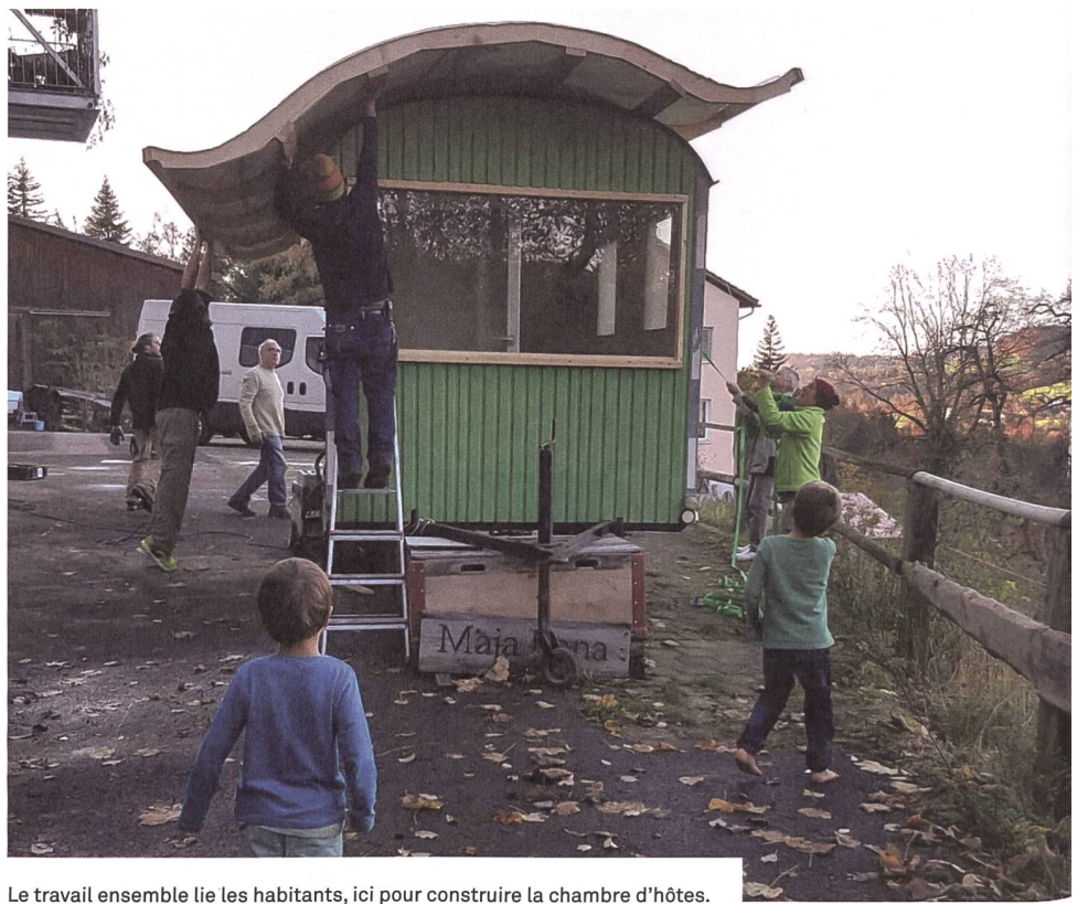
Le travail ensemble lie les habitants, ici pour construire la chambre d'hôtes.