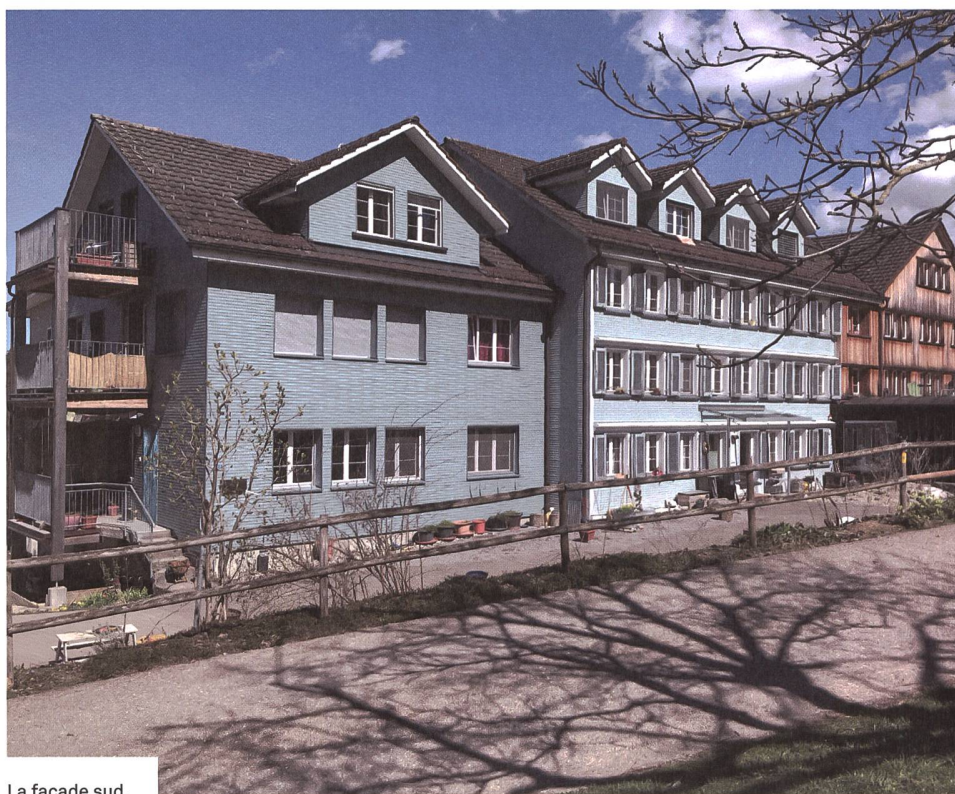
La façade sud.

La coopérative Wogeno-Mogelsberg a défini cinq valeurs sur lesquelles elle base son style de vie: écologie, communauté, responsabilité, activités sociales et d'entraide, éthique. Elle est autogérée et fonctionne sur un mode participatif. D'un point de vue organisationnel, les différentes structures mises en place au départ ont fait leurs preuves. Toutes les décisions importantes sont prises par une assemblée générale qui a lieu une fois par mois et un comité est en charge de la coordination, des aspects adminis-