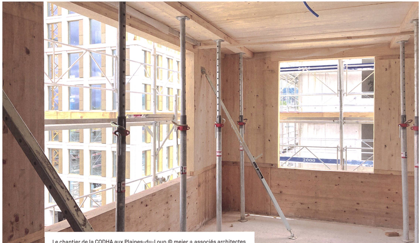
Le chantier de la CODHA aux Plaines-du-Loup. © meier + associés architectes

terrain public, on peut éventuellement demander que la rente de superficie soit adoucie, amoindrie ou reportée. Mais les communes souhaitent aussi percevoir l'argent. C'est une période difficile: nous sommes au cœur de l'orage et, s'il perdure trop longtemps, les coûts se répercuteront sur les loyers.»