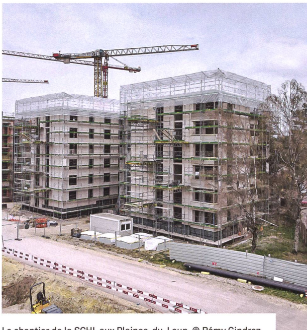
Le chantier de la SCHL aux Plaines-du-Loup.

terrain public, on peut éventuellement demander que la rente de superficie soit adoucie, amoindrie ou reportée. Mais les communes souhaitent aussi percevoir l'argent. C'est une période difficile: nous sommes au cœur de l'orage et, s'il perdure trop longtemps, les coûts se répercuteront sur les loyers.»