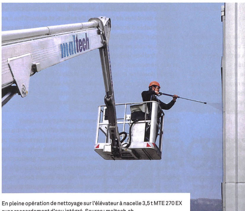
En pleine opération de nettoyage sur l'élévateur à nacelle 3,5 t MTE 270 EX avec raccordement d'eau intégré.

Je me souviens surtout de ces situations où l'accès à notre lieu d'intervention s'est avéré très, très compliqué. Par exemple dans la « cour de récréation » de la HEP Zurich. Ou dans l'atrium de la prison de district de Dietikon. Ce qui distingue ces interventions des autres, ce ne sont pas tant les missions en elles-mêmes, mais plutôt la manière dont Maltech a abordé la situation avec nous, en faisant preuve d'une incroyable ouverture d'esprit pour parvenir à des solutions innovantes. C'est ainsi que ce qui nous semblait impossible à prime abord, est devenu possible.