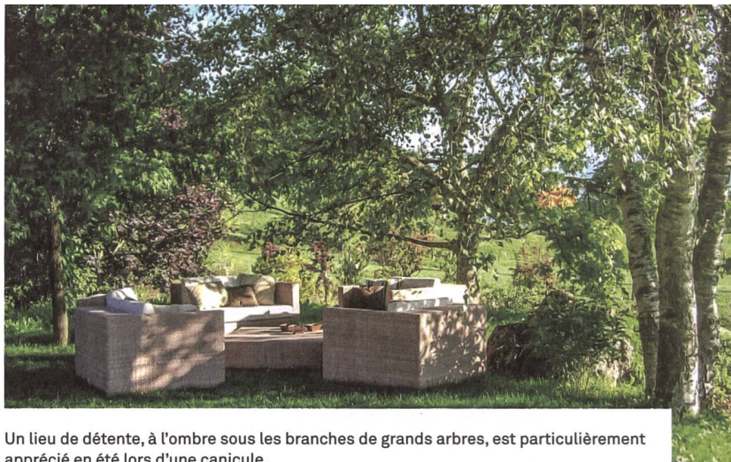
Un lieu de détente, à l'ombre sous les branches de grands arbres, est particulièrement apprécié en été lors d'une canicule.