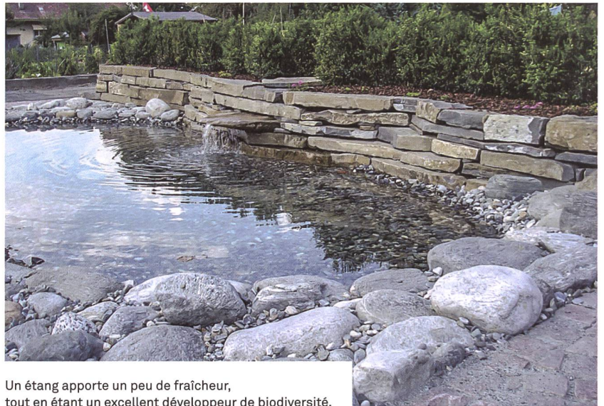
Un étang apporte un peu de fraîcheur, tout en étant un excellent développeur de biodiversité.