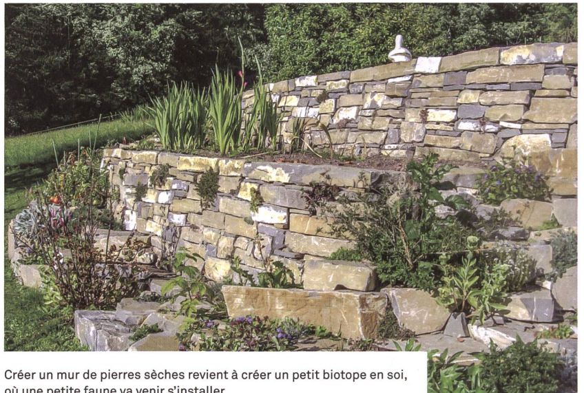
Créer un mur de pierres sèches revient à créer un petit biotope en soi, où une petite faune va venir s'installer.

piqué-niques et grillades, zone pour les chiens, espace de jeux pour les adolescents (football, basket), tout en créant des chemins pour les piétons et/ou les cyclistes, et des accès aux immeubles. Tous les espaces doivent aussi être accessibles aux personnes à mobilité réduite.