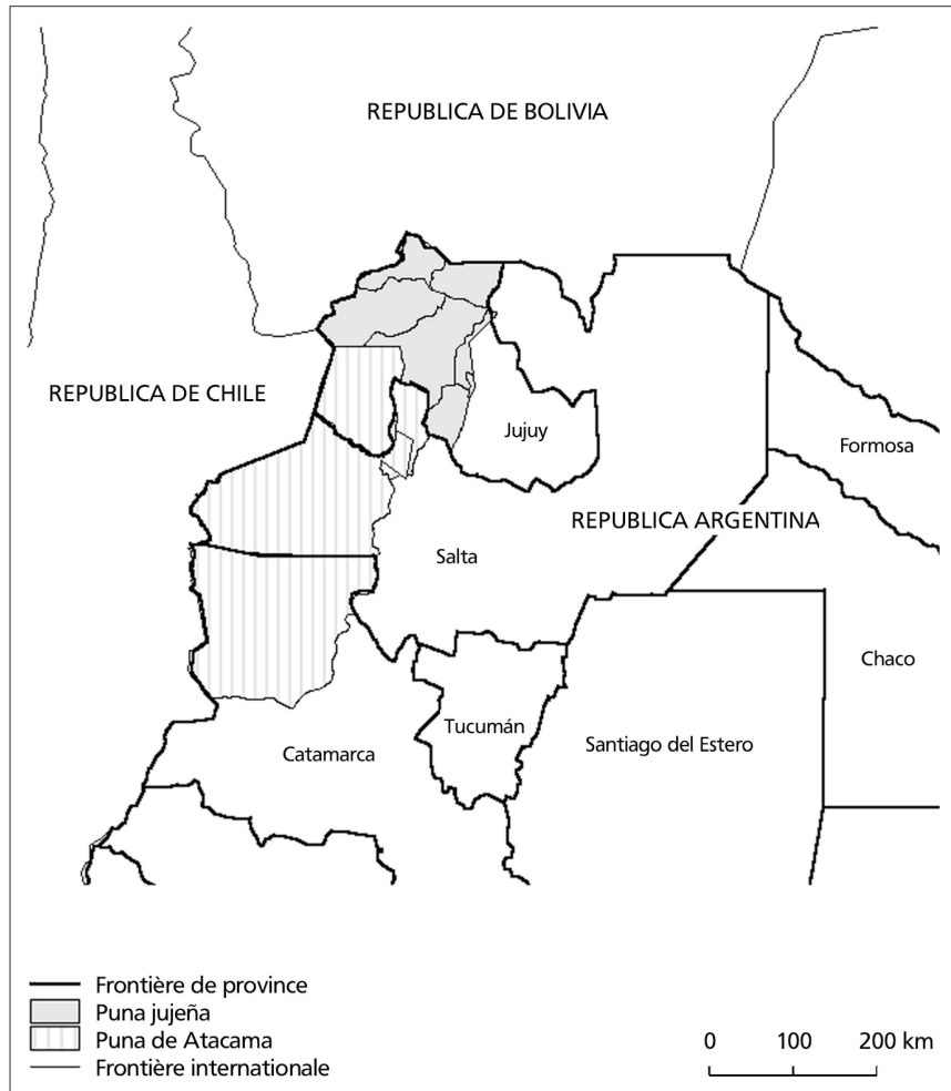
Carte 1: Localisation de la Puna.

la migration dans les terres basses de la province. Depuis lors, les hauts plateaux de Jujuy occupent une position périphérique. Durant les premières décennies du XX e siècle, l'organisation territoriale en vigueur durant la période coloniale fut l'objet d'une profonde modification, suite à l'intégration définitive de la province de Jujuy dans le marché national. Tout au long