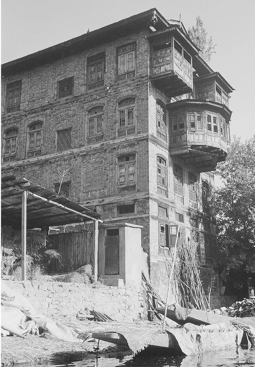
Abb. 1: Srinagar. Wohn- und Gewerbehaus an einem Kanal.