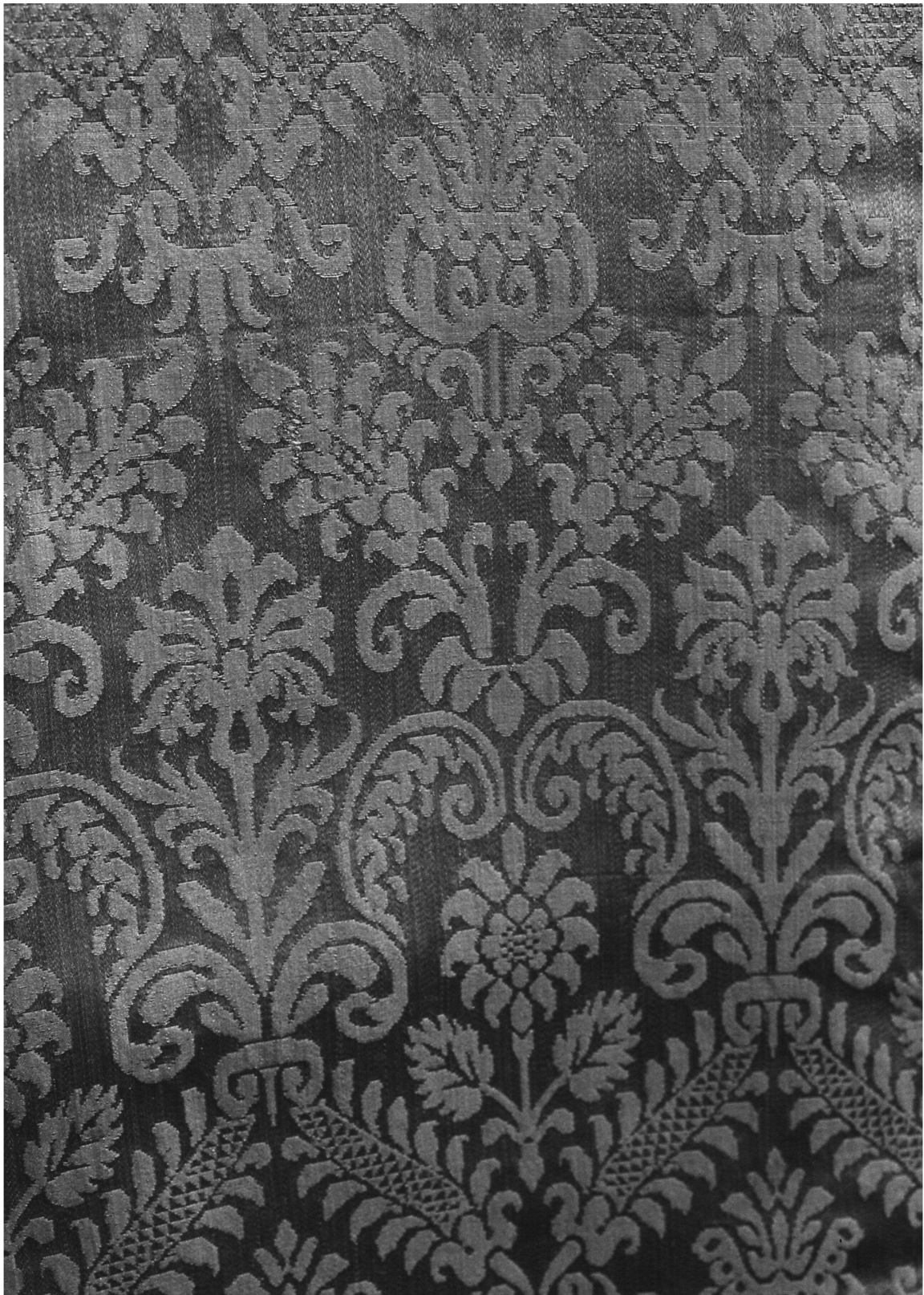
Fig. 2: Particolare della pianeta in damasco viola della chiesa di Maria Vergine Assunta, frazione Salecchio di Premia (VB).