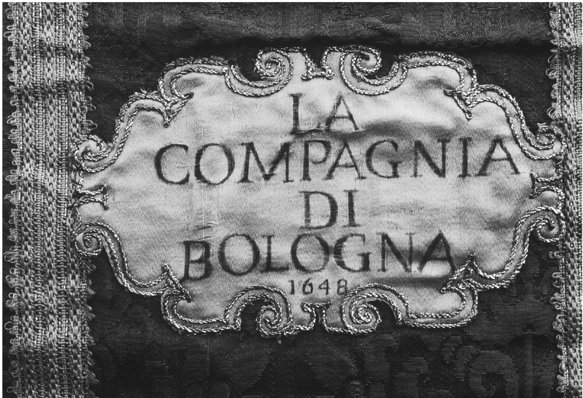
Fig. 1: Particolare del cartiglio appartenente alla pianeta in damasco viola della chiesa di Maria Vergine Assunta, frazione Salecchio di Premia (VB).

caso di quella bolognese, pur essendo molto studiata dal punto di vista sociale ed economico, ben poco si conosce degli aspetti tecnico-artistici che caratterizzavano i suoi prodotti. Le fonti documentarie restituiscono una città nella quale, all'inizio del XVII secolo erano attivi quasi cinquecento telai nel settore denominato dell' Opera tinta , destinato alla produzione di generi tessili quali i damaschi, i broccati, i velluti. Ma individuarli, nell'insieme degli esemplari antichi (nonché finti antichi) che si sono andati stratificando negli armadi da sacrestia o nei musei, ed assegnare loro una datazione precisa, risulterebbe un'impresa quasi impossibile.