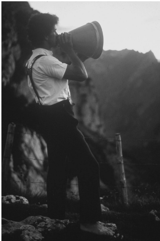
Abb. 1: Alpsegenrufer in Innerrhoden. Foto: Cyrill Schläpfer 1990.

Der Milchtrichter wird in der Innerschweiz Volle genannt. Dieser Begriff lässt sich aus dem Volleschübel erklären, dem Kolbenbärlapp, dessen Wurzel früher in den Trichter gestopft wurde, um die gröbsten Unreinlichkeiten in der Milch beim Umgiessen vom Melkeimer in die Milchkanne aufzufangen.