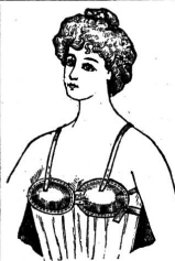
Patent in der Schweiz angemeldet