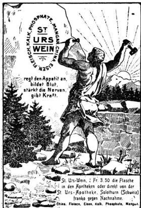
Hebammen erhalten höchstmöglichen Rabatt!

Dieser Fall gibt zu denken. Welche Hebamme hätte nicht ebenso wie sie gehandelt, auch ohne 100 Fr. Belohnung, um einem armen Kindchen zu guter Unterkunft zu verhelfen? Konnte sie wissen, daß sie von einer gewissenlosen Betrügerin als Werkzeug ausgetoren war? Wir erzählen die Geschichte als ernste Warnung für die Hebammen. Nicht zu leichtgläubig und vertrauensvoll sollen die Hebammen sein, sondern sich genau über die Personalien und Verhältnisse von Leuten erkundigen, die mit dem Begehren um Vermittlungsdienste an sie herantreten.