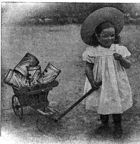
Galactina für das Brüderchen.

Einen grossen Fehler begehen diejenigen Mütter, die ihre Kinder einzig mit Kuhmilch auferziehen, da bekanntlich der besten Kuhmilch die Knochen und Muskel bildenden Bestandteile fehlen. Vom dritten bis zum zwölften Monate benötigt ein jedes Kind eine Beinahrung. Man gebe ihm daher dreimal täglich, zuerst in der Saugflasche, später als Brei, das vorzügliche, zur Hälfte aus Alpenmilch bestehende