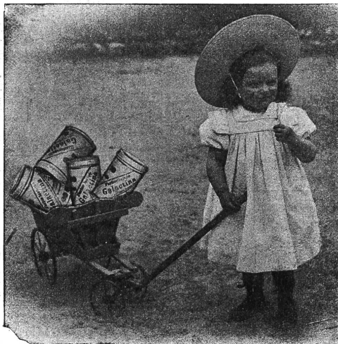
Galactina für das Bräuerchen.

Länggasskrippe Bern schreibt: Wir verwenden seit Jahren Galactina in allen Fällen, wo Milch nicht vertragen wird; selbst bei ganz kleinen Kindern hat sich in Krankheitsfällen Galactina als lebensrettend bewährt. Sehr wertvoll ist Galactina in Zeiten, wo nasses Gras gefüttert wird, auch während der grössten Hitze, wo trotz aller Sorgfalt die Milch sehr rasch verdirbt.